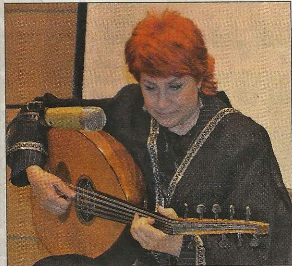
الفنانة سحر طه خلال انشادها