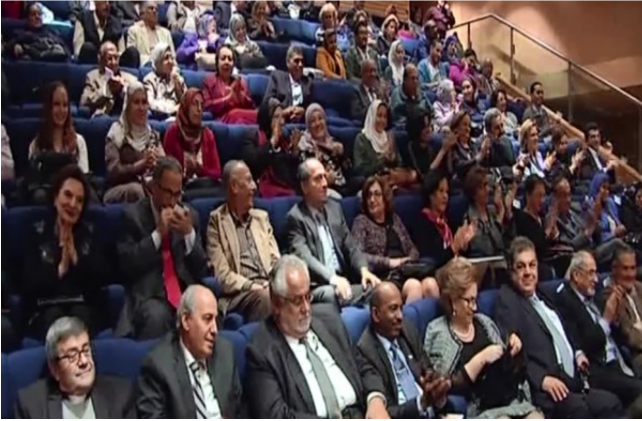
جميع الحقوق محفوظة لدنيا الوطن © 2003 - 2014