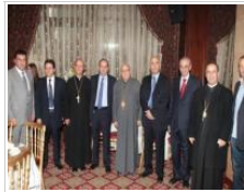
تكريم القاضي فوزي خميس