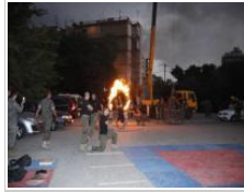
إختتام المهرجان المسيحي الحدادي عشر