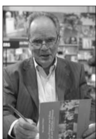
● إبراهيم تابت: فرنسا في لبنان والشرق الأوسط»