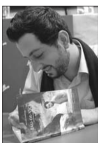
● مارون بشاره يوقع «ماء الرذيلة»