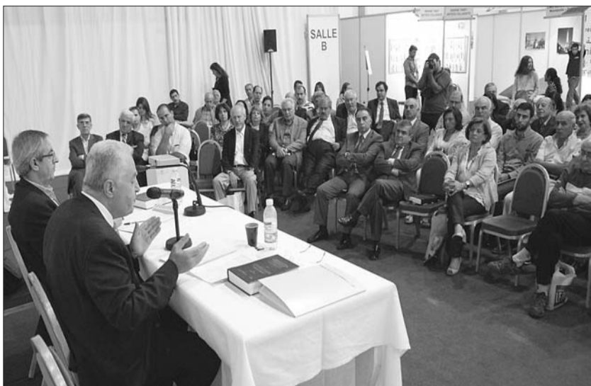
● من اللقاءات المباشرة بالكتاب