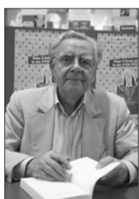
● بنتار بيفو يوقع: «رجل، وما هو السؤال؟»